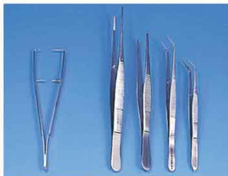
① ② ③ ④ ⑤