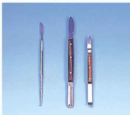
① ②+③ ④+⑤