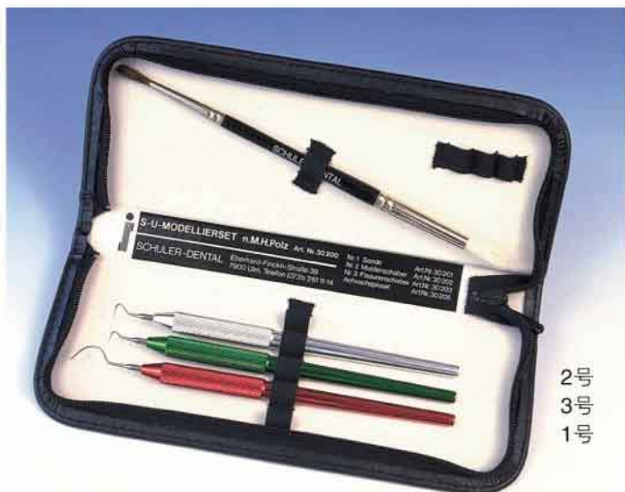
2号 3号 1号