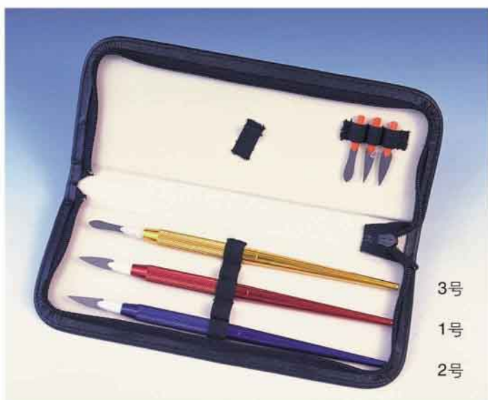
3号 1号 2号